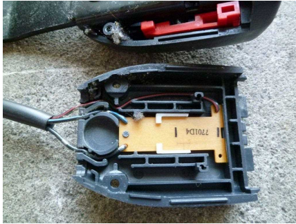
シートベルトのバックル内部