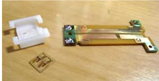
スイッチは開放型