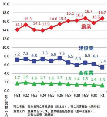
就業人口10万人あたり死亡事故発生件数の推移