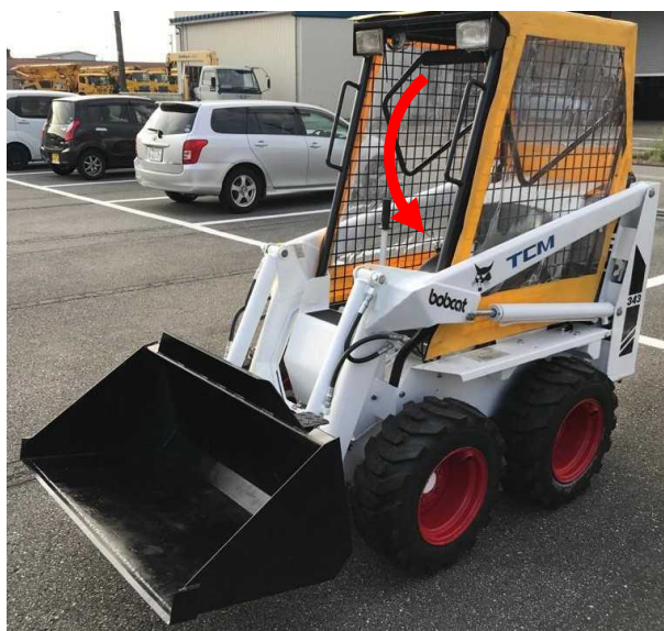
座席を離れるときのシートバー位置