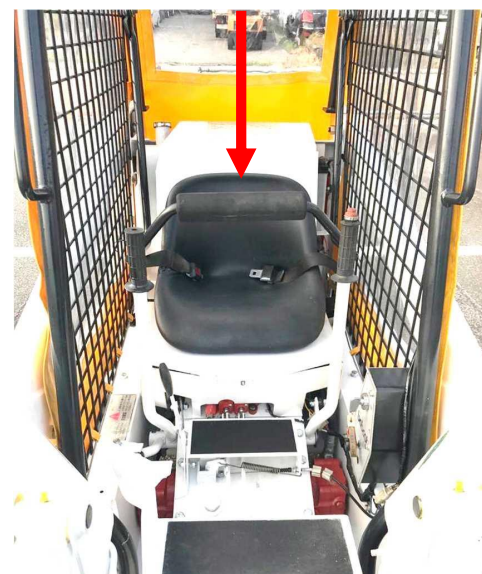
運転時のシートバー位置