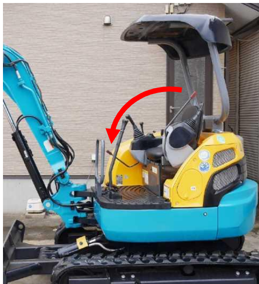
座席を離れるときの操作レバー位置