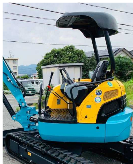
運転時の操作レバー位置